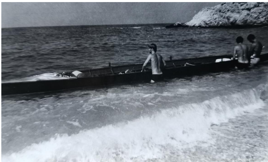
Sl.1. Jadranaši na plaži ispod Lubenica 1973.